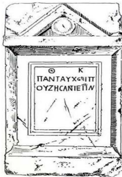
Slika 9. (preuzeto iz Patsch, 1914, 187)