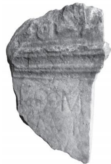
Slika 10. (preuzeto iz Ferjančić&Samardžić, 2014, 274)