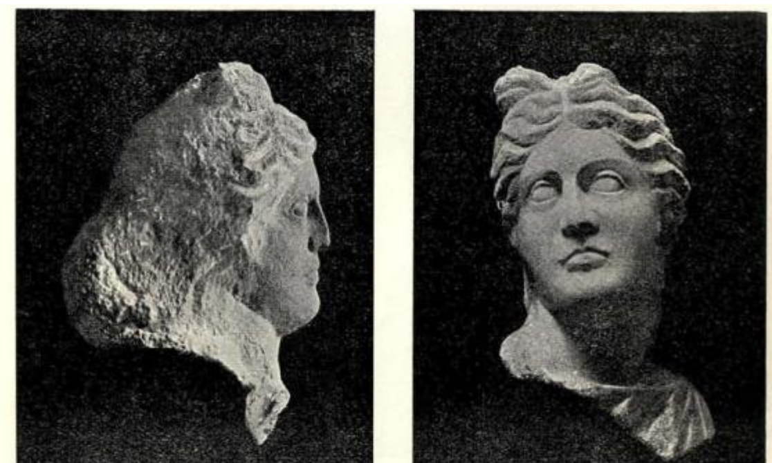
Slika 12. (preuzeto iz Patsch, 1909, 123)