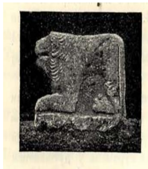
Slika 11. (preuzeto iz Patsch, 1909, 130)