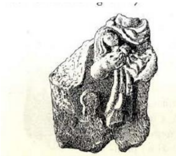
Slika 5.