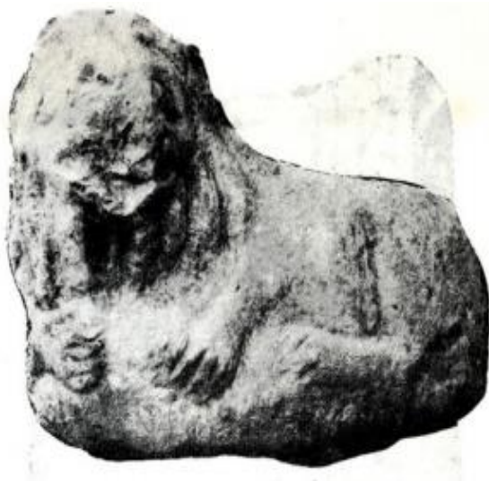
Slika 1.