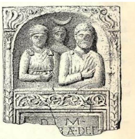
Slika 4.