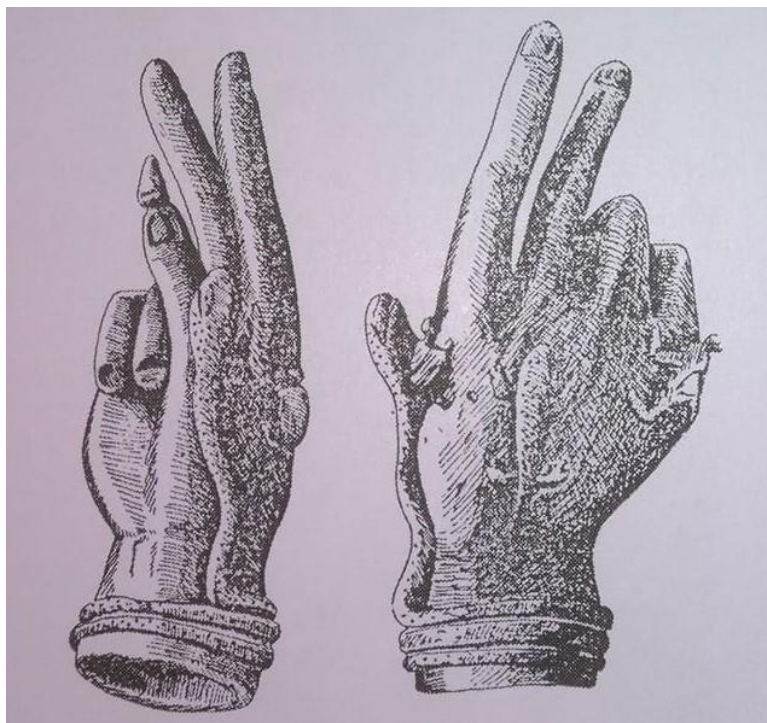
Slika 13. (preuzeto iz Zotović, 2002, 57)