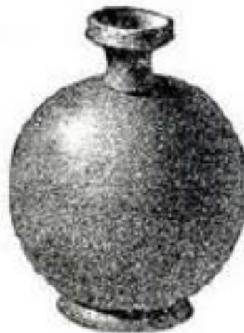
Slika 6.