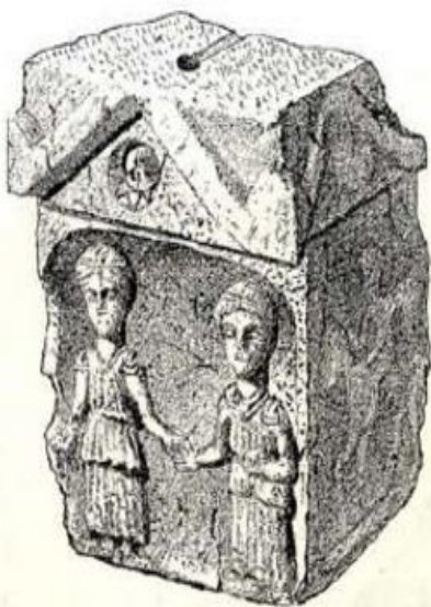
Slika 3.