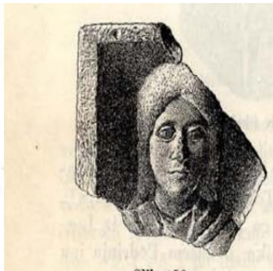
Slika 2. (Preuzeto iz: Patsch 1907, 454)