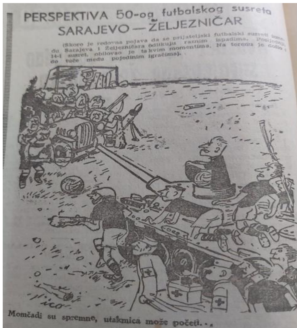
Slika br. 5. Karikatura: Perspektiva 50. fudbalskog susreta Sarajevo – Željezničar. Fiskultura i sport , br. 211, 11.09.1950.

može početi. Da se „ratno stanje“ u gradskom derbiju više ne bi ponavljalo, odlučeno je da ove ekipe u februaru 1950. godine odrade zajedničke zimske pripreme na Starom Kaštelu, s ciljem da se nogometaši više sprijatelje. 349 Kao najbolji odgovor na pitanje da li su se popravili odnosi igrača ove dvije ekipe može ponuditi karikatura objavljena u septembru iste godine. Odnosi između sarajevskih bokserskih klubova „Milicioner“ i „Romanija“, također nisu bili dobri, jer su jedni drugima vrbovali igrače nudeći razne stipendije i druge vidove koristi. 350