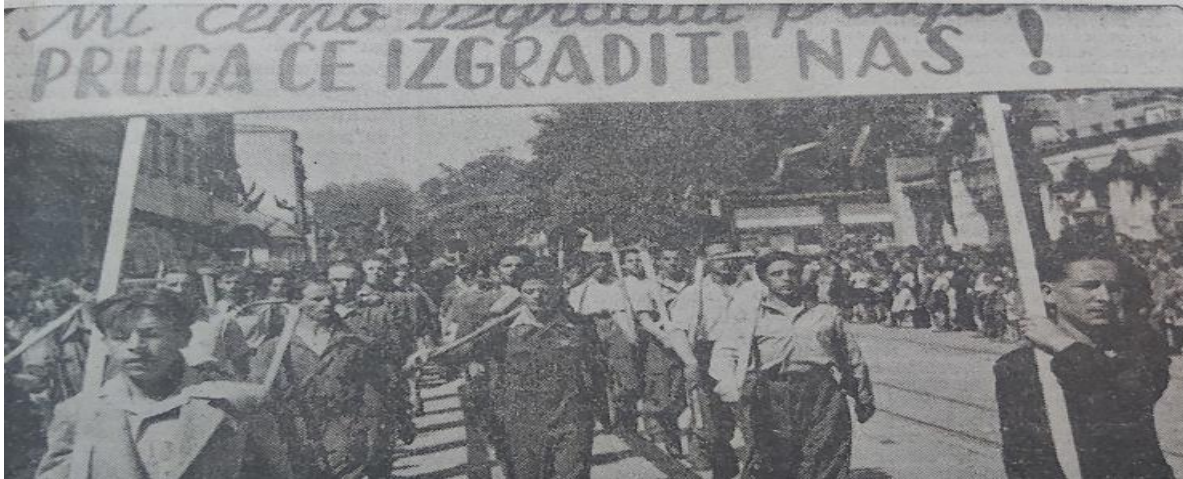
Slika br. 4. Parola graditelja omladinske pruge: „Mi ćemo izgraditi prugu, pruga će izgraditi nas!“ Fiskultura i sport , br. 35 (10), 05.05.1947.

Na drugom nogometnom savjetu FISAJ-a donesena je odluka da nogometaši učestvuju u izgradnji pruge Šamac – Sarajevo, koji su imali obavezu, kao i svi ostali, da učestvuju i kao graditelji i kao fiskulturni takmičari. Učestvovati nisu mogli oni koji su imali slabe ocjene u školama i koji se ne zalažu dovoljno za proizvodnju u fabrikama i preduzećima. 318 Za loše omladince ovo je bila kazna ili pedagoško-vaspitna mjera, te im je uskraćena čast učešća u izgradnji domovine, vjerovatno dok se ne poprave. Ovo je možda i najbolji primjer koji pokazuje kakva je omladina potrebna društvu za izgradnju socijalizma. Interesantna je odluka fiskulturnog društva „Crvena Zvezda“ da 10% svojih prihoda od utakmica donira za aktivnosti fiskulturnika na pruzi, jer su za ispravan fiskulturni razvoj na pruzi bili potrebni rekviziti. 319