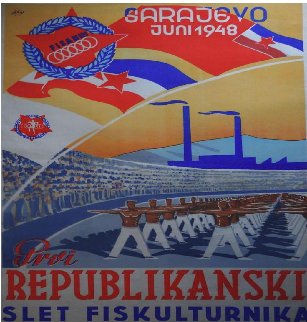
Slika br. 2. Promotivni plakat prvog republičkog sleta 252