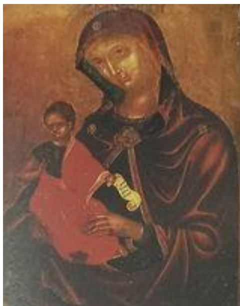
Slika 2. Bogorodica sa Hristom – Italo-grčki majstor – 15./16. Stoljeće - Retrospectum . Katalog. Sarajevo: Umjetnička galerija BiH. Sarajevo, 2008.