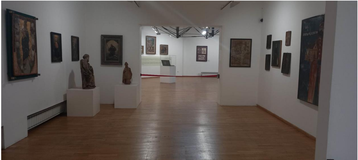
Slika 4. Ikone u stalnoj postavci Galerija entuzijazma - Umjetnička galerija BiH – 17.04.2023.