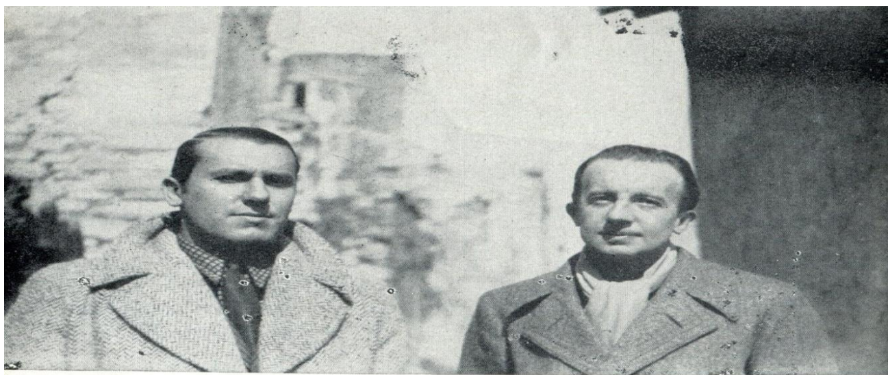
RENÉ CHAR et PAUL ELUARD. Gordes 1931

Bilski Éluardov prijatelj, René Char, pjesnik i esejist, rođen je 14. juna 1907. godine u L'Isle-sur-la-Sorgue, Vaucluse, a preminuo je 19. februara 1988. godine. Njegov otac, biznismen i lokalni gradonačelnik, umro je kada je Char imao samo deset godina. Ovaj ključni događaj mnogi kritičari vide kao uticaj na njegovo djelo, ne toliko kao temu pjesama, već kao doprinos osjećaju otuđenosti i samoće koje ti kritičari pronalaze kao osnovnu temu u mnogim Char-ovim pjesmama. Iako je bio obrazovan, Char nije završio svoje srednjoškolsko obrazovanje učeći za maturu, već je odlučio da pohađa poslovnu školu 1925. godine. Služio je vojni rok u artiljerijskoj jedinici od 1927. do 1928. godine. Tokom tog vremena, objavio je svoju prvu malu zbirku pjesama Les Cloches sur le cœur ( Zvona na srcu ). Ovo je bilo jedino djelo koje je objavio pod svojim pravim imenom, René-Emile Char. Godinu dana poslije, Char je objavio drugu zbirku poezije Arsenal , te iste godine zajedno s Andréom Cayatteom, osnovao časopis Meridians . Poslao je zbirku svojih pjesama Éluardu, s kojim je ubrzo postao blizak prijatelj, pa je Éluard i proveo nekoliko sedmica kod Chara u Isle-sur-la-Sorgue, da bi zajedno, kasnije živjeli u Parizu. Ranih 1930. godina možemo ih vidjeti zajedno na fotografiji Valentine Hugo, kada su posjetili Menerbes, Gordes, Lacoste i Saumane.